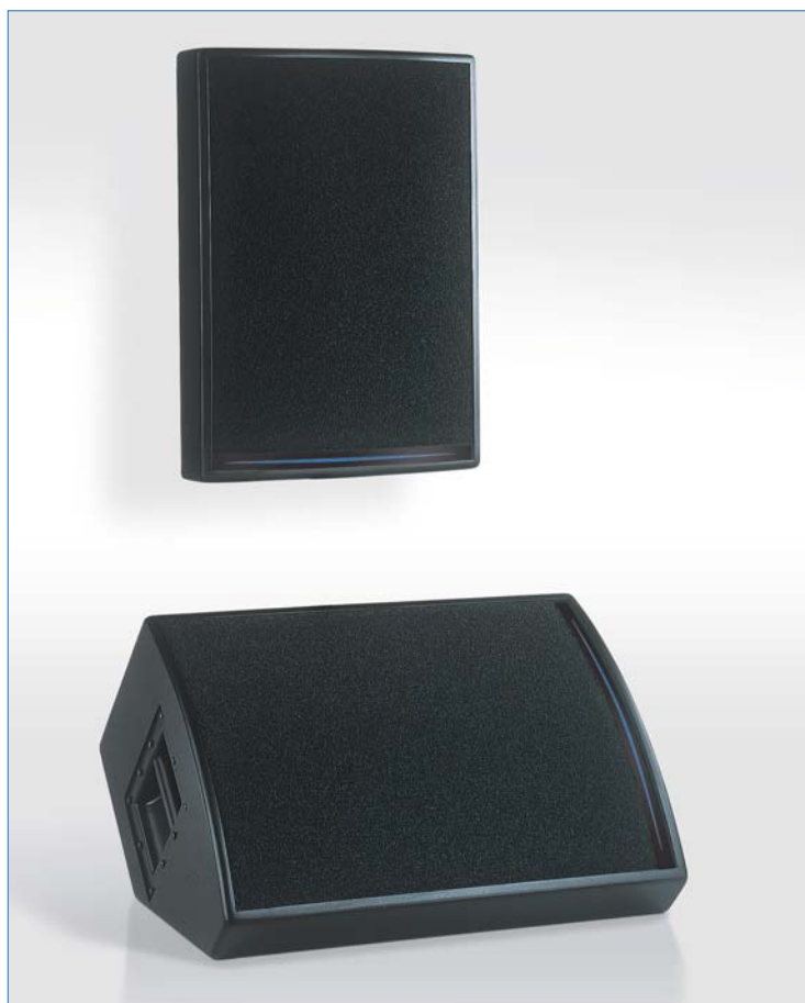
Enceintes DS15 présentée en façade et en retour de scène

La DS15 est une enceinte offrant une totale polyvalence entre les applications de façade et de retour de scène. Elle se caractérise par une qualité et une finesse de restitution sonore proche de celle des meilleurs moniteurs de studio.